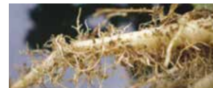
Resultat från försök med Pinkstart